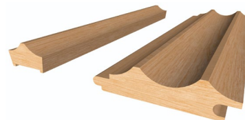
Figure 5. Vue en coupe isométrique du PROFILE - FJORD (Mini et Standard)