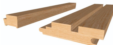
· Figure 3. Vue en coupe isométrique du PROFILE - CLIFF (Mini et Standard)