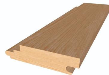
· Figure 1. Vue en coupe isométrique du PROFILE - HORIZON (Standard)