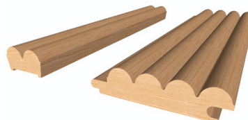
Figure 7. Vue en coupe isométrique du PROFILE - COLLINE (Mini et Standard)