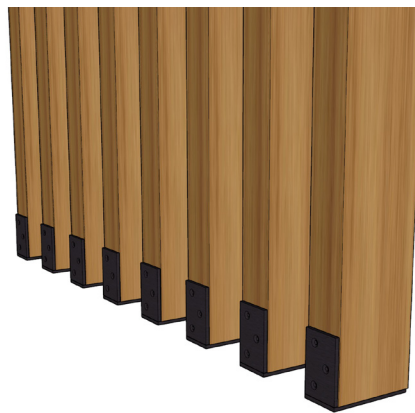
Avec équerre de métal

Veillez consulter le guide d'installation de la collection LINEAR de Woodzco pour les détails.